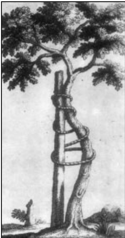
ن. ناندری. نرتۆپدی یان هونهری پیتشگیری و چاکسازی خواروختیچی جهستهی مندالان (۱۷۴۹)

گۆرانکاری سهرهکی و کۆمهلیک پیتشکهوتن له تهکنیکدا پروویان داوه. شتیوازی دیسیپلینی نوێ سهریان ههڵداوه و ئەم شتیوازانە پیتوهندییهکی ئالۆزیان له گهڵ دهسهلاتدا دروست کردووه. بهم شتیوهیه فوکو له سهر ئهو پروایهیه که ئەم گۆرانکاریانە ته نیا کۆمهلیک ته عدیل و نهرمی و دلۆقانی و سهر به خۆی به لێن دراوه که پیتک نه هاتوو و له ئاکامدا ئیمه پیمان نه ناوه ته ئاستانهی زانستی سهر به خۆوه.