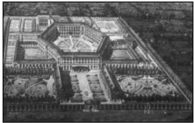
زیندانی ناوهندی پټن (۱۸۷۷)

ټوکسانه کی که وهکو بابهت تهسه ور کراون و بابهتسازي ټو کهسانه کی که کوټ کراوان، ناشکرا دهکات» (پيشسو، ۱۸۵ل). ټمه دهتوانيت لانی کهم لهرووی بوچوونه وه گورانکاریبه کی یارمه تیده ر بیت. بوټوونه دهتوانین حالته تی نهخوشخانه بینینه بهرچاوی خوټمان. لهسه دهی حهټده، پزیشک سهردانی نهخوشخانه کی دهکرد، بهلام هینده خوټی له بهرپوه بردنیدا ههټنه دهقورتاندا، بهلام ټو بههوی ماهیبه تی ټو جوړه مهعریفه بهی که بهدوایدا دهگهرا و ههروهها بههوی ټو شیوازانه کی که له پیناوی بهدهسته پینانی ټم مهعریفه به بهکاری دههینا، ورده ورده کهوته مهوقیفی گیروددهبون و خوټیتههټقورتانديکی روو له زیاد (لهکاروباری نهخوشخانه دا). هیدی هیدی که نهخوشخانه وهکو ناوهنديکی پهرورده و مهعریفه ی تاقیکاری و ټهزمونی لیتهات، پزیشک روټیکی زیاتری لهکاروبارهکانیدا پهیدا کرد؛ ژماره ی یارمه تیده رهکانی زیاتر دهبون؛ تهنانهت شکلی نهخوشخانه ش گورانکاری بهسهردادهات بوټوهی قیزیت و موعایه نهکانی پزیشک کهببوو به تهوهری سهرهکیبی ئیداره ی کاروباری نهخوشخانه، به ئسانی ټه نجام بدریت. ههروهکو فوکو خوټی له کتیبی (لهدایک بوونی دهزمانگه) به چهشینکی رازیکه ر پيشانی داوه که نهخوشخانه تی هتاو به دیسپلین کراو به شپوهی هاوتای مادی مهعریفه ی پزیشکی سهری ههټدا. ټم جوړه گورانکاریبانه نه بټ مهترسی بوون و نه کهمبایه خ.